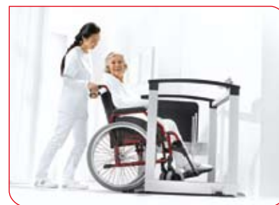
Les fauteuils roulants accèdent facilement à la plateforme grâce à la rampe intégrée.