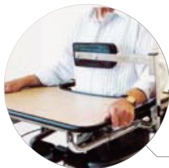
Appui frontal et thoracique (réglable en hauteur)