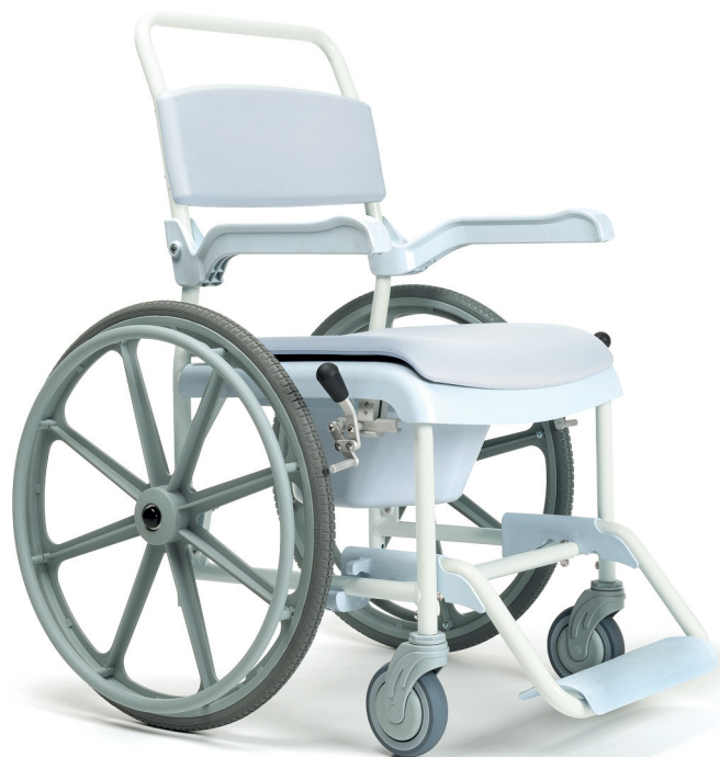
Pluo, modèle avec roues de 24"

Pluo est une chaise de douche hygiénique, confortable et moderne. L'assise et le dossier sont confortables et faciles à nettoyer. Sa hauteur d'assise lui permet de passer au-dessus la plupart des toilettes pour être utilisé si besoin.