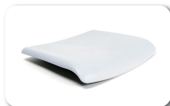
Siège confort en PU