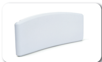
Dossier confort en PU