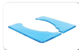
Assise gel amovible