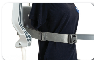
Ceinture de sécurité