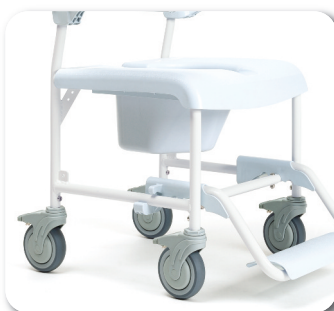
Freins séparés sur les 4 roues (uniquement sur le modèle 5")