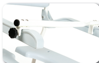
Barre de sécurité