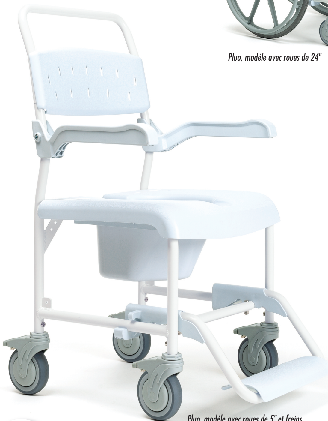
Pluo, modèle avec roues de 5" et freins