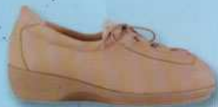
Aire version ①