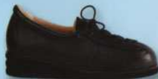
Aire version ②