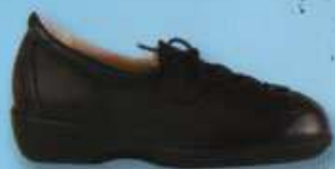
Aire version ①

CHUP code 201H00 - Chaussure basse - Cuir pleine fleur noir ou beige. Disponible du 35 au 42 - Existe en 2 versions.