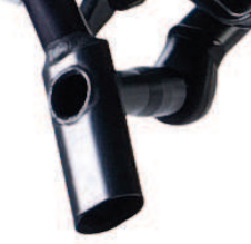
Poignée droite, angle 25°, tube ovale