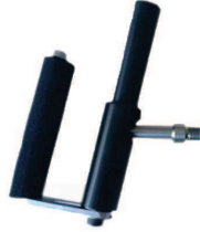
Support tétraplégique pour la main