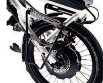
Fixation latérale bagages