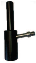
Poignée droite, angle 10°, tube rond