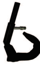
Support tétraplégique pour avant bras