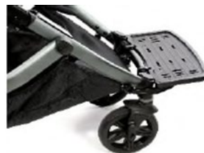
Plateforme utilitaire à l'avant