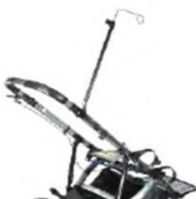
Tige porte sérum