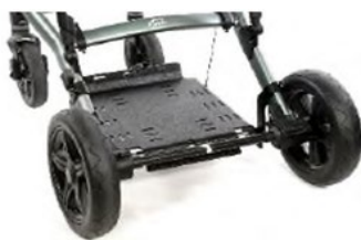
Plaque rigide sous l'assise pour batteries et ventilateur