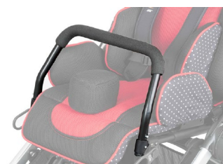
Barre de maintien