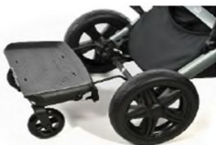
Plateforme utilitaire à l'arrière