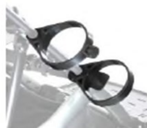
Support bouteille oxygène