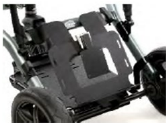
Plateforme pour ventilateur