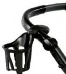
Porte bouteille (max 0,5 kg)