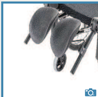
MB 22 Repose-moignon