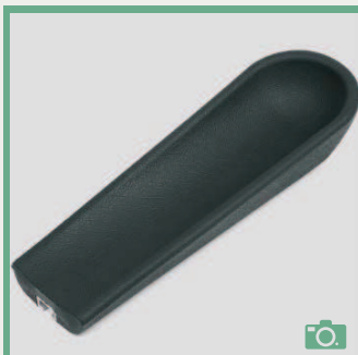
ME 72/73 Coudière longueur 35,5cm