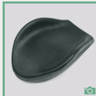
ME 76/77 Appui-main courbe