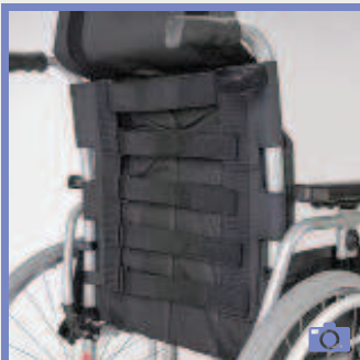
MD 19 Toile de dossier réglable en tension, 5 bandes