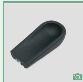
ME 72/73 Coudière longueur 20,5cm