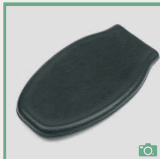
ME 74/75 Appui-main plat