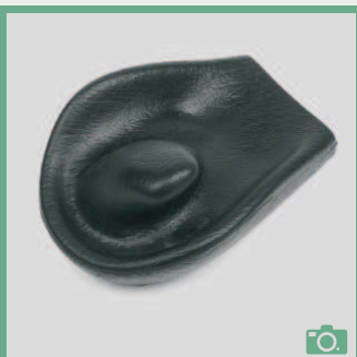
ME 78/79 Appui-main à corne courbe