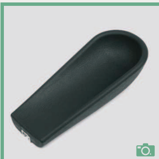
ME 72/73 Coudière longueur 29cm