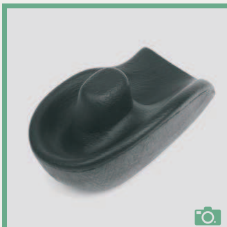
ME 80/81 Appui-main à corne