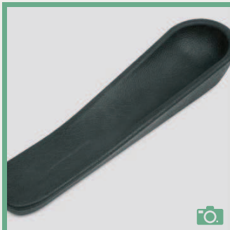
ME 70/71 Gouttière d'une pièce, longueur 46cm