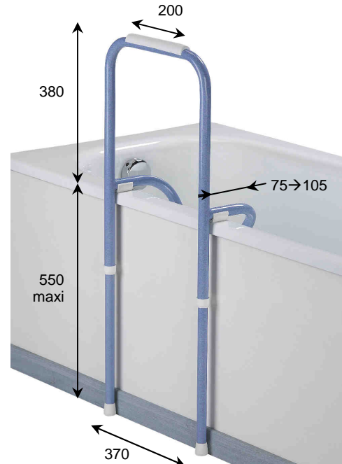
Balnéo 100 en configuration d'utilisation

Garantie produit : 1 an contre tout vice de fabrication