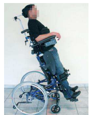
Illustration de la bascule d'assise à son niveau maximum avec la verticalisation