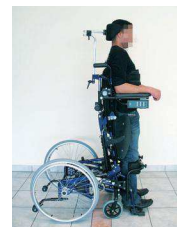
Illustration de la verticalisation

Illustration de l'inclinaison du dossier et de la bascule d'assise