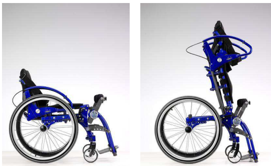
Vue en détail de la verticalisation manuelle assistée par le verin à gaz.

Poids maximum 100 kg (75 kg pour la version Junior).