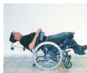
Illustration de l'inclinaison du dossier et de la bascule d'assise