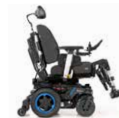
Q500 H SEDEO PRO

Ingénierie de pointe. Adaptée à vos besoins.