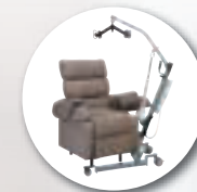
Kit accès soulève-patient