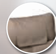
Protection de tête