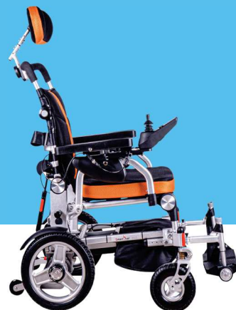
SmartChair EVO 2