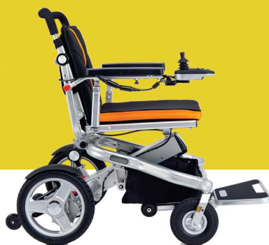
SmartChair TRAVEL MAX