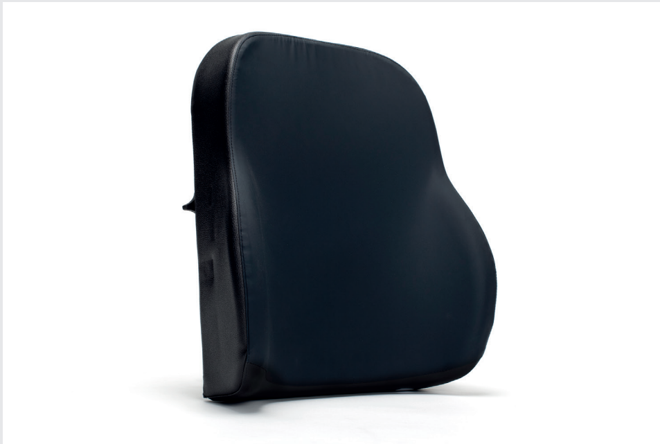
Coussin de dossier préformé - L34