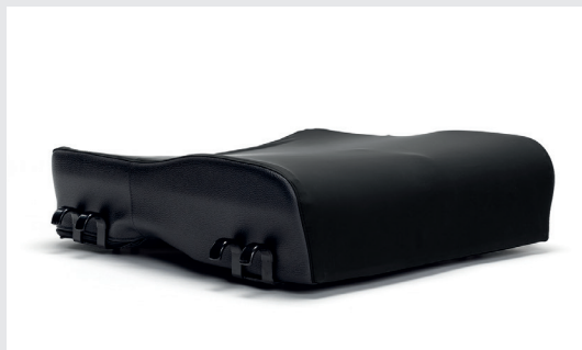
Coussin d'assise anatomique préformé - L35