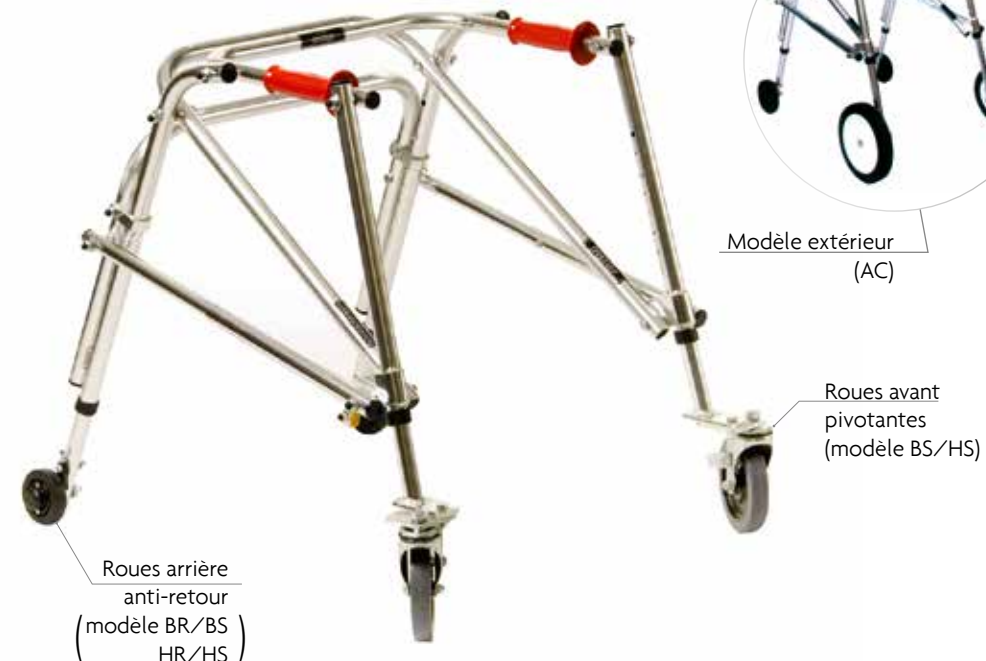
Roues arrière anti-retour (modèle BR/BS HR/HS)