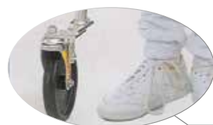
Roues avant pivotantes