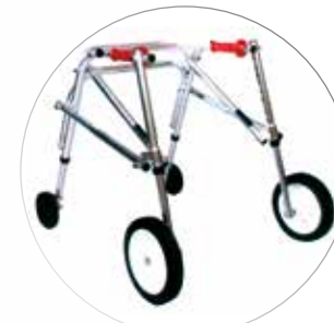
Modèle extérieur (AC)