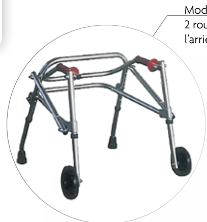
Modèle de base 2 roues avec patins à l'arrière (modèle B)