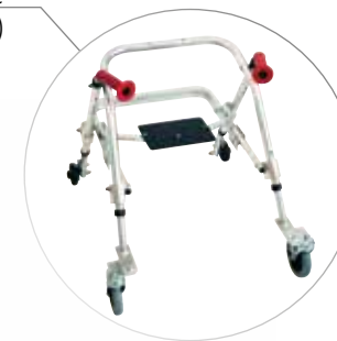
Modèle avec siège (HR/HS)