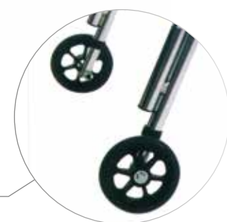
Roues arrière anti-retour «Silent» (modèle BRX)