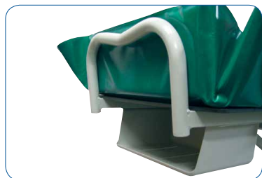
Panier porte-vêtements en série.