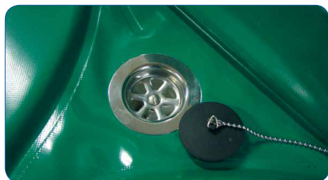
Bonde d'évacuation simple d'utilisation. Plan incliné à 2°.