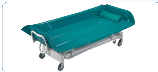
Le transfert du patient est facilité grâce à la position basse de 52 cm. En approchant le chariot douche près du lit, le transfert peut être réalisé par une seule personne.