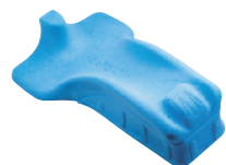
Cale de positionnement au lit P912L