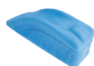
Cale de positionnement au lit P915L