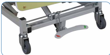
Option : freinage centralisé. Accessibilité et facilité d'activation

2 finitions de panneaux PITCHOUNE KALIN Modèle avec montants laqué blanc recevant des barrières pleine longueur ou modèle collectivité pour les barrières époxy avec housse de protection pour plus de sécurité.