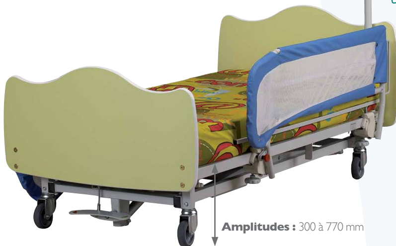
Amplitudes : 300 à 770 mm