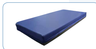
Matelas PEDIA Confort en mousse mixte viscoélastique, protégé par une housse CIC