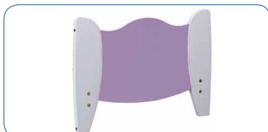
Panneaux adaptés à l'univers des enfants : Blanc/Kiwi ou Blanc/Parme

Faciliter les levés et les transferts lit-fauteuil grâce à la mise à plat du sommier à une hauteur de 300 mm.