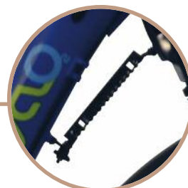
Ressort de rappel de direction