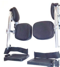
Repose Jambes Ergonomique FAW1020