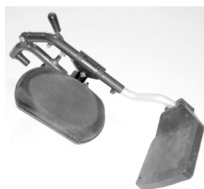
Repose Jambes FAW1062