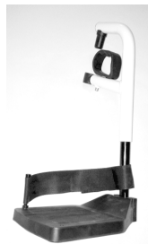
Repose pieds FAW1060