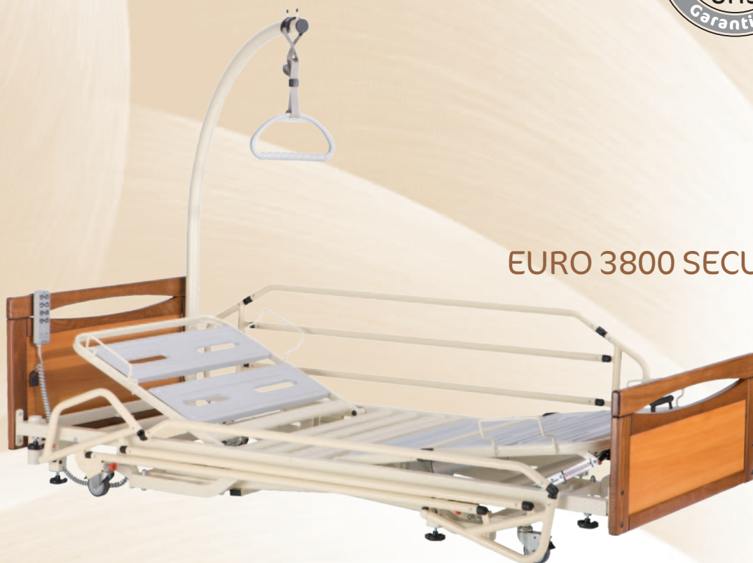
EURO 3800 SECURIS