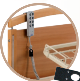
Télécommande : verrouillage par clé magnétique, simple d'emploi et sûre.