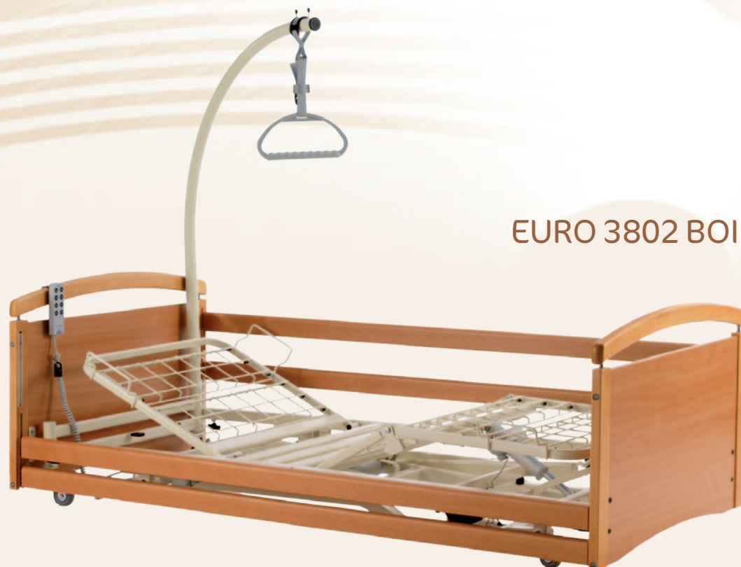
EURO 3802 BOISERIE