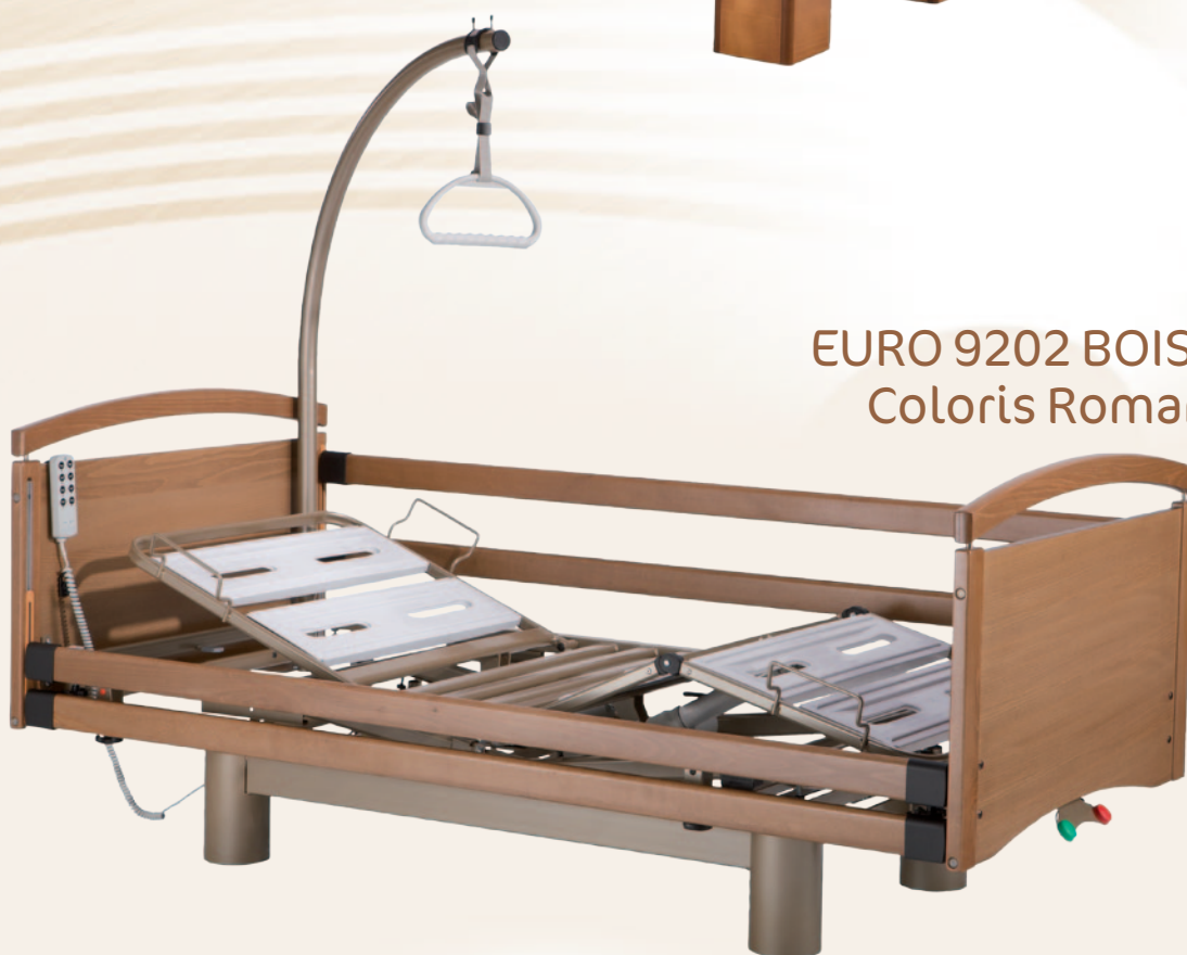
EURO 9202 BOISERIE Coloris Romana