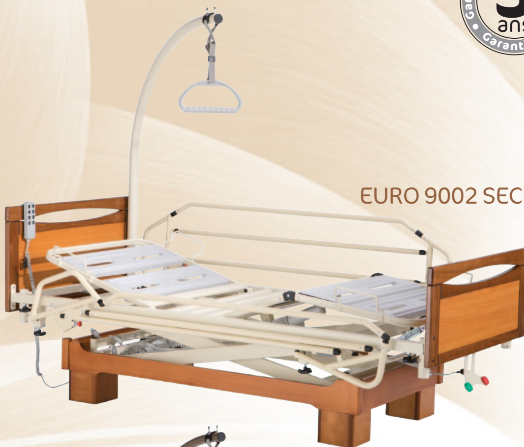
EURO 9002 SECURIS