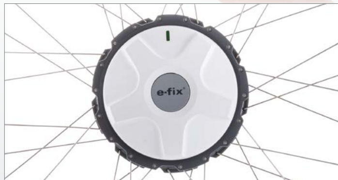
Motorisation compacte, légère, et puissante