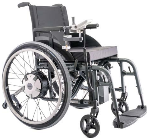
e-fix E36: Roues motrices plus puissantes que la version E35