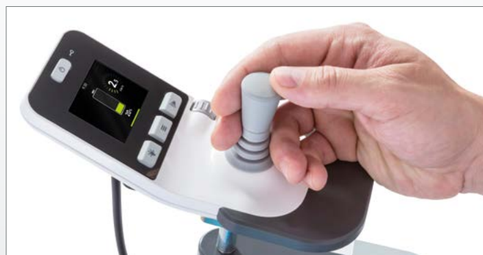
Écran couleur d'informations et éléments de commande conviviaux