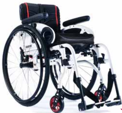
XENON 2 SA LE PASSE-PARTOUT