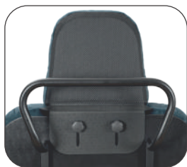
tête réglable en hauteur