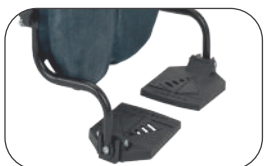
repose-pieds escamotables, réglables en hauteur et amovibles