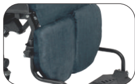
repose-mollets escamotables, et amovibles