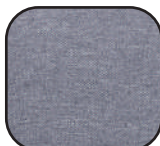
tissu gris chiné