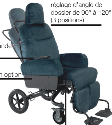
réglage d'angle de dossier de 90° à 120° (3 positions)