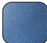
PVC bleu océan