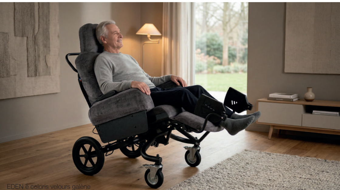
EDEN e coloris velours galène

parce que votre CONFORT est au COEUR de nos préoccupations !