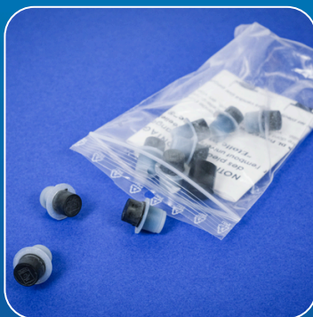
Sachet de 10 pieds de remplacement avec notice