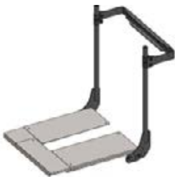
Système d'assise REHAB, cadre de dossier Rehab