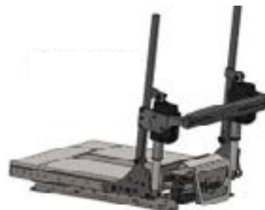
Dossier électrique 0° - 160°