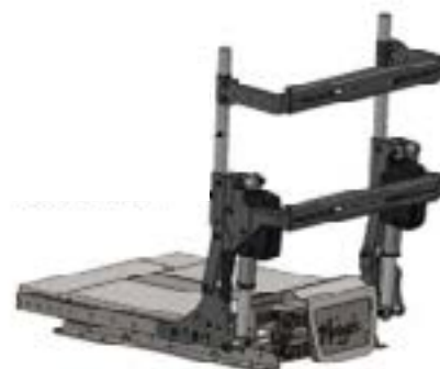
Dossier électrique à compensation 0° - 155°